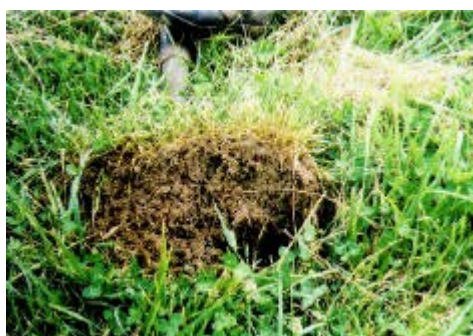
2 sols voisins après 4 mois de sécheresse sans arrosage (Australie): agriculture conventionnelle : sol compacté - agriculture biodynamique : sol structuré.