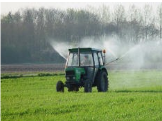
Pulvérisation de la préparation "Silice de Corne 501"

Ces préparations doivent être diluées dans l'eau et brassées durant exactement une heure avant d'être pulvérisées pour entrer en contact avec le sol ou les plantes. Les quantités employées sont très faibles (90 à 120 grammes dans un volume de 30 à 50 litres d'eau par hectare pour la bouse de corne et seulement 4 grammes par hectare pour la silice de corne). Lors du brassage, la formation d'un tourbillon profond (vortex) et d'un chaos énergétique sont essentiels. Pour un néophyte, il est absolument indispensable d'être assisté et conseillé par une personne d'expérience.